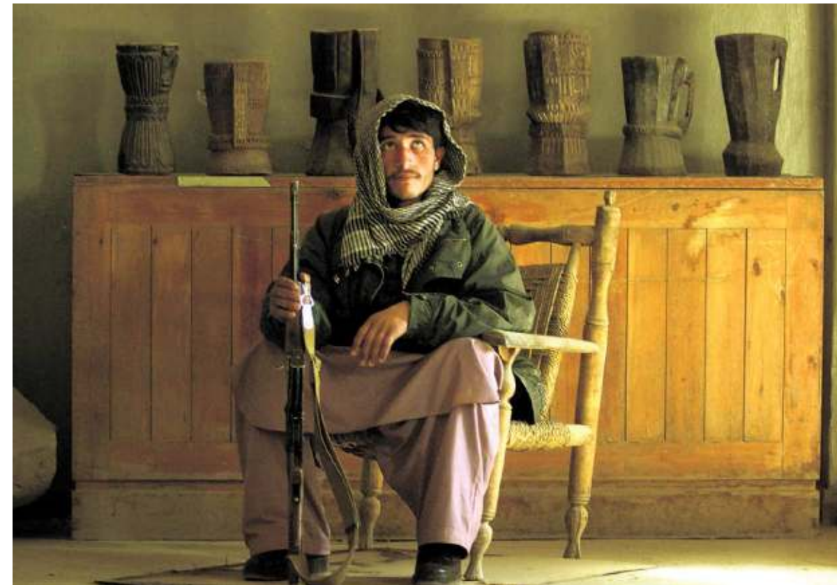
MUSEUMLEVEN IN KABUL DE SUPPOOST