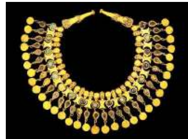
Bacterisch Goud uit de 1ste eeuw na Christus.