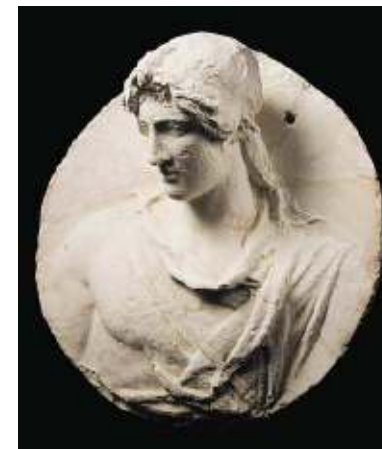
Afghaanse topstukken zijn alleen nog, gefotografeerd in boeken, te zien. Niet in het Nationaal Museum van Kabul.