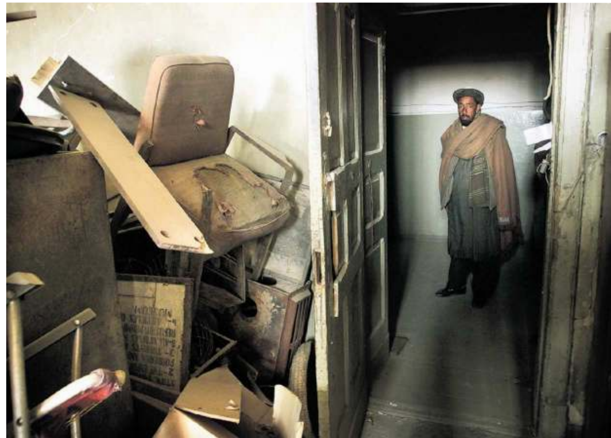
MUSEUMLEVEN IN KABUL HET DEPOT