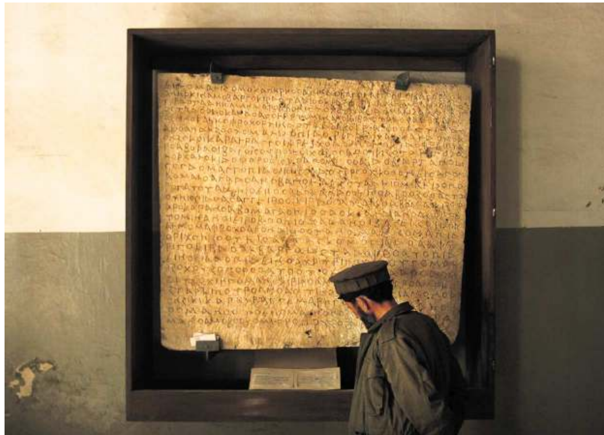
MUSEUMLEVEN IN KABUL DE BEZOEKER

Sinds enkele jaren heeft Afghanistan een erfgoedpolitie van 500 man, die de archeologische vindplaatsen en musea bewaken en gestolen waar opsporen.