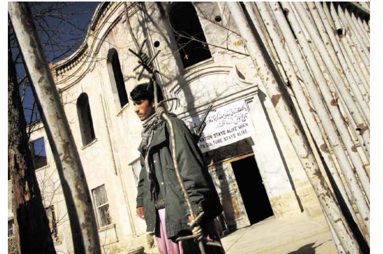
MUSEUMLEVEN IN KABUL DE HOOFDINGANG VAN HET NATIONAAL MUSEUM