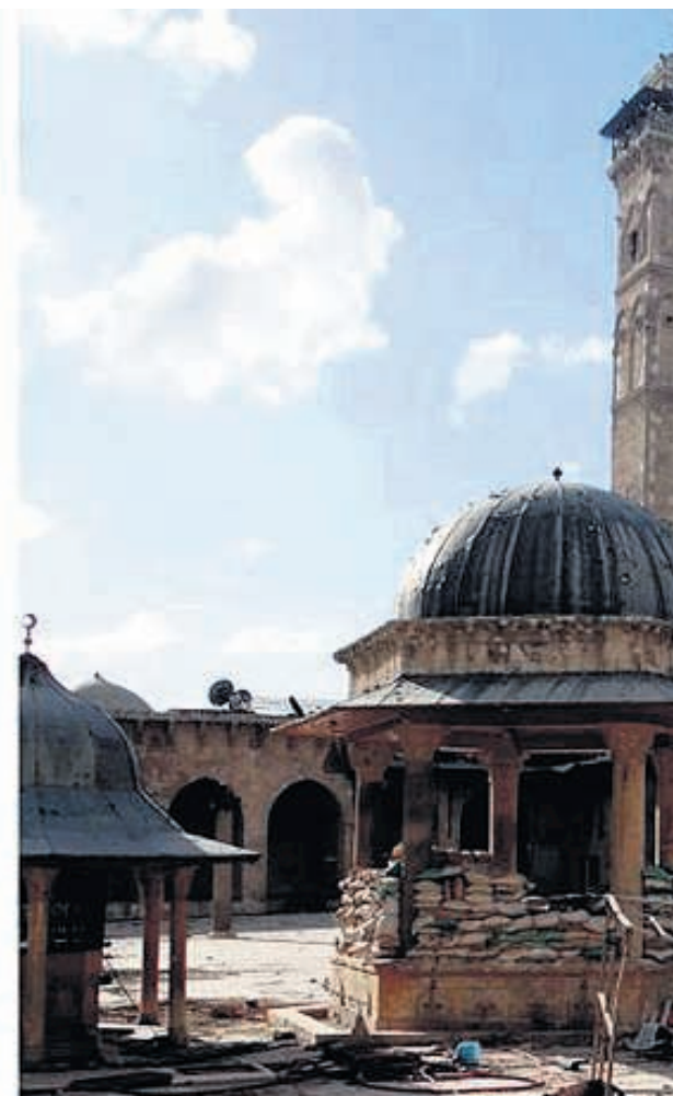
Na zware beschietingen vorig jaar stortte de beroemde minaret van de Omajjadenmoskee in Aleppo in. De minaret, die dateerde uit de achtste eeuw, was een van de oudste ter wereld. Wie verantwoordelijk was voor de puinhoop viel niet te achterhalen.